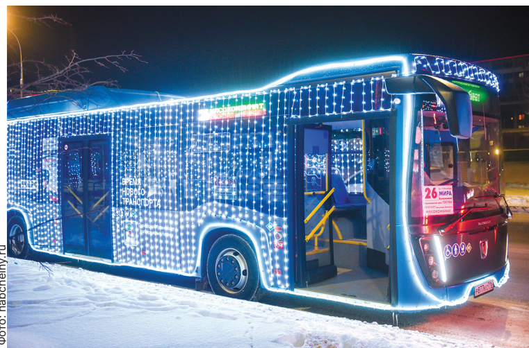
■ Засияли автобусы к новогодним праздникам