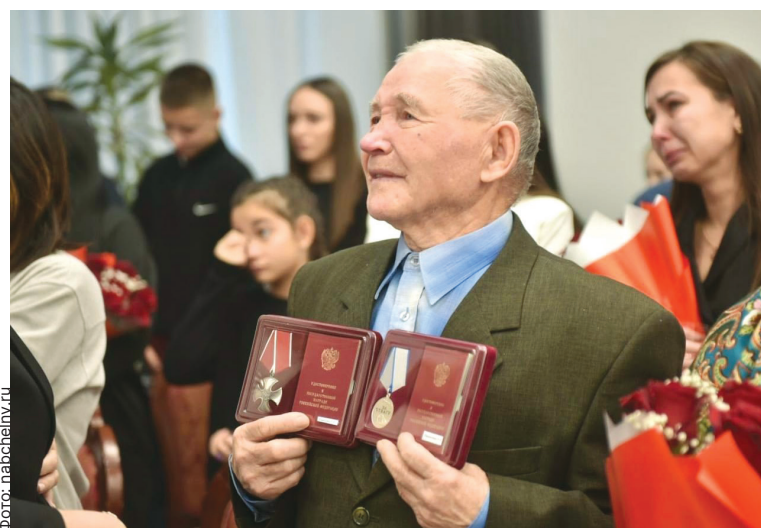
■ 2025 год будет объявлен в России и Татарстане Годом защитника Отечества