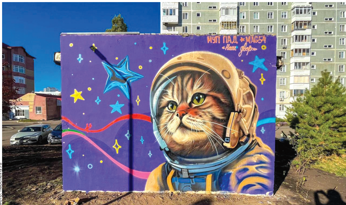
■ Больше ярких красок в городскую жизнь

го оборудования, изготовлены и смонтированы 1 120 скамеек, 1 058 урн, 118 хозяйственных площадок, 111 парковочных столбиков и полусфер, а также 24 площадки для ТКО.