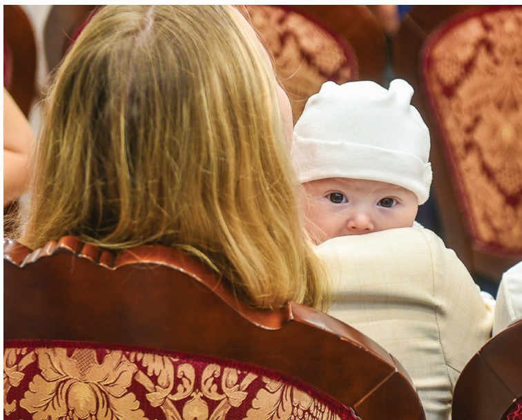
■ 62 700 сертификатов на материнский (семейный) капитал выдано челнинским семьям

Все эти события и мероприятия нацелены на создание крепких семей, в которых царит любовь и взаимное уважение, воспитываются несколько детей и традиционные семейные ценности сохраняются в новом современном облике.