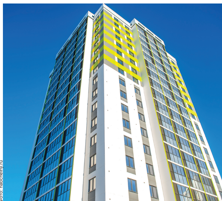
■ Дом, который построил КАМАЗ. В этом году сданы 2 арендных дома для работников автогиганта

В следующем году планируется отремонтировать вторую часть проспекта Яшьлек и закончить ремонт Боровецкого моста.