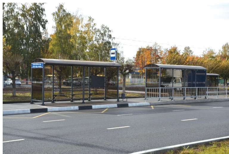
■ В ходе ремонта установлены и новые остановочные павильоны