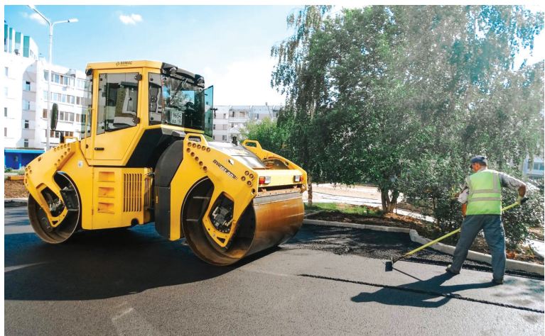
■ Работы выполнялись сотрудниками «Предприятия автомобильных дорог»

Работы по освещению выполнены во всех дворах – смонтированы 1 569 новых опор освещения. Установлены 696 элементов детского и спортивно-