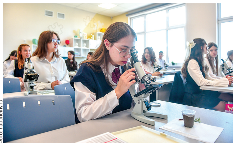
■ В новом профильном лицее №42 обучается уже 1 628 учеников