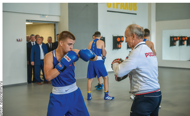
■ Всем бокс! Теперь все спортивные залы «Олимпийский» оснащены по современным требованиям

В текущем году благоустроен 71 двор на общую сумму 1 млрд 700 млн руб. В шаговой доступности от домов появились современные, разнообразные детские и спортивные площадки.