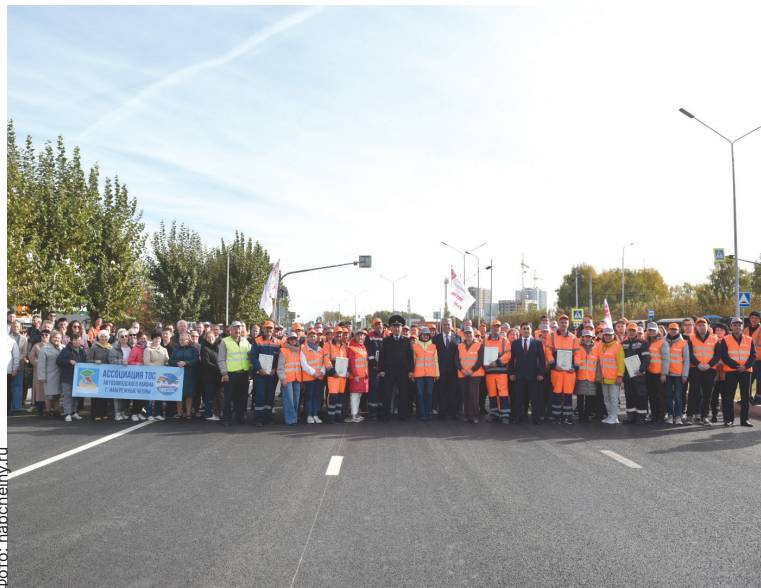
■ Благодаря их труду появляются хорошие дороги