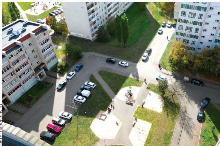
■ В текущем году в автограде благоустроен 71 двор

В 2025 году под программу благоустройства попали 79 челнинских дворов. В следующем номере мы представим полный список дворов.