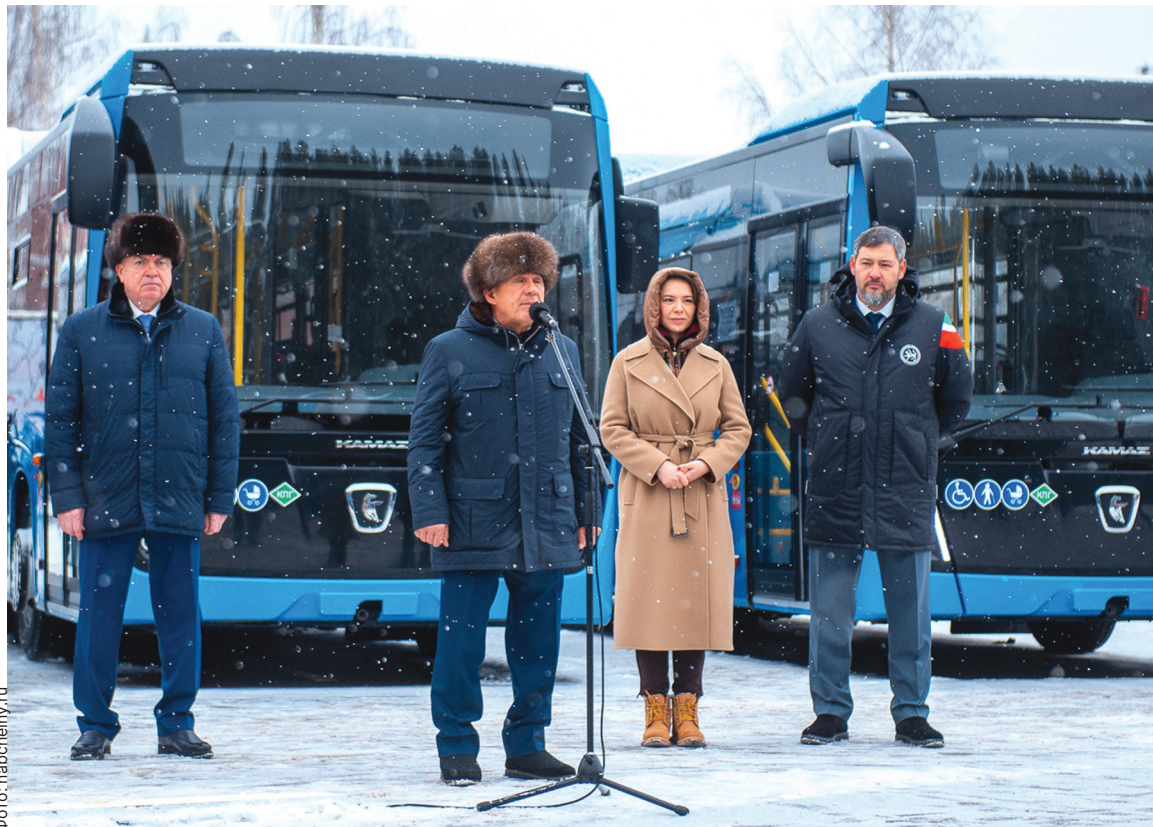
■ Рустам Минниханов лично передавал Челнам партии больших автобусов

В преддверии новогодних праздников сотрудники МУП «Горкоммунхоз» украсили автобусы большой вместимости новогодними атрибутами. Снаружи их украшает яркая гирлянда, а внутри – искусственные еловые ветки и елочные игрушки со снежинками. Теперь в салоне общественного транспорта царит настоящая сказочная атмосфера.