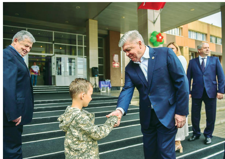
■ Для детей организуют различные виды поддержки