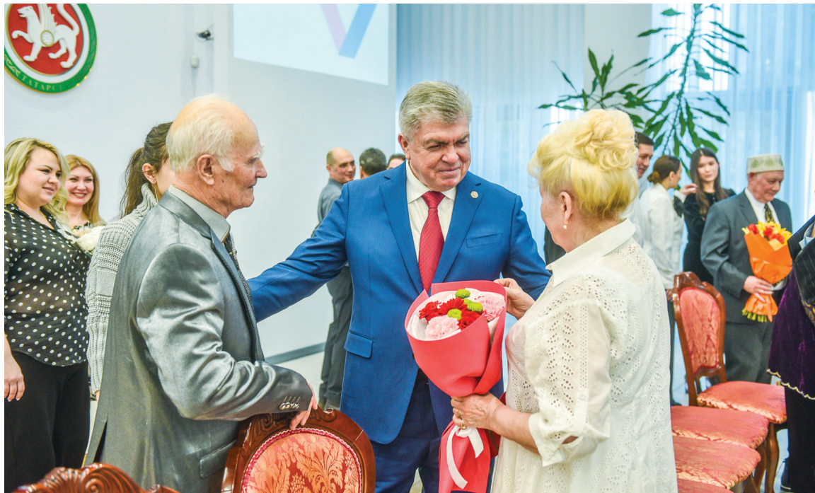
■ В этом году в параде юбиляров семейной жизни приняли участие 120 пар, которые живут вместе 50, 60 и даже 70 лет

Свыше трех тысяч пар скрепили свой союз узами брака. Для челнинских молодоженов есть пример – с огромным уважением и почетом мы приветствует бриллиантовых, золотых, серебряных юбиляров семейной жизни – это достойно внимания