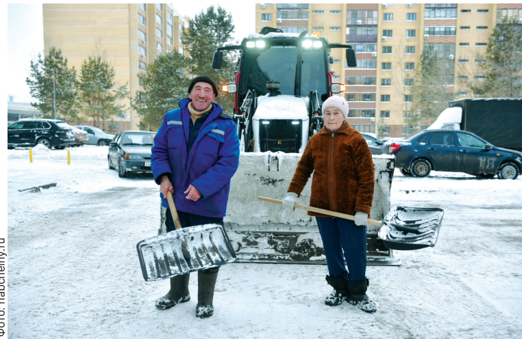
■ Вместе с самого детства, еще и работа объединяет

По возвращении с армии пара поженилась, в 1988 году пе-