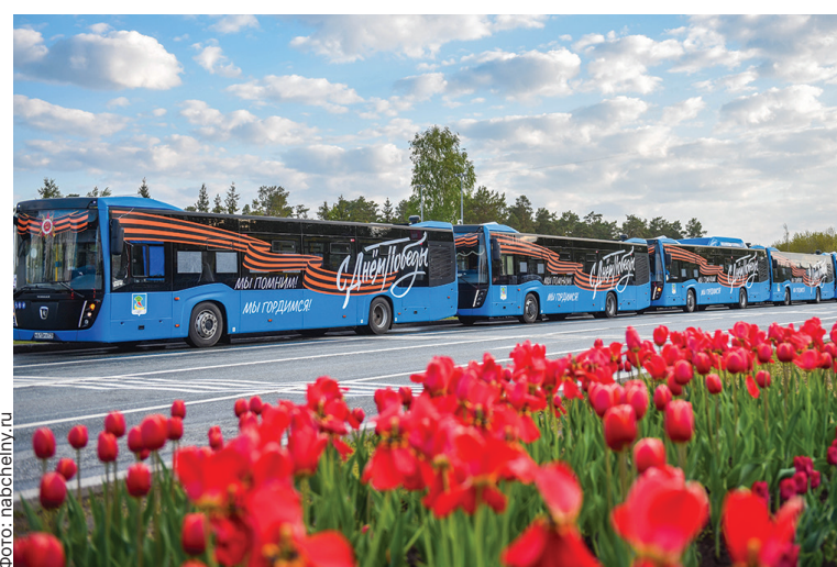
■ Георгиевские ленты украсили не только грудь челнинцев