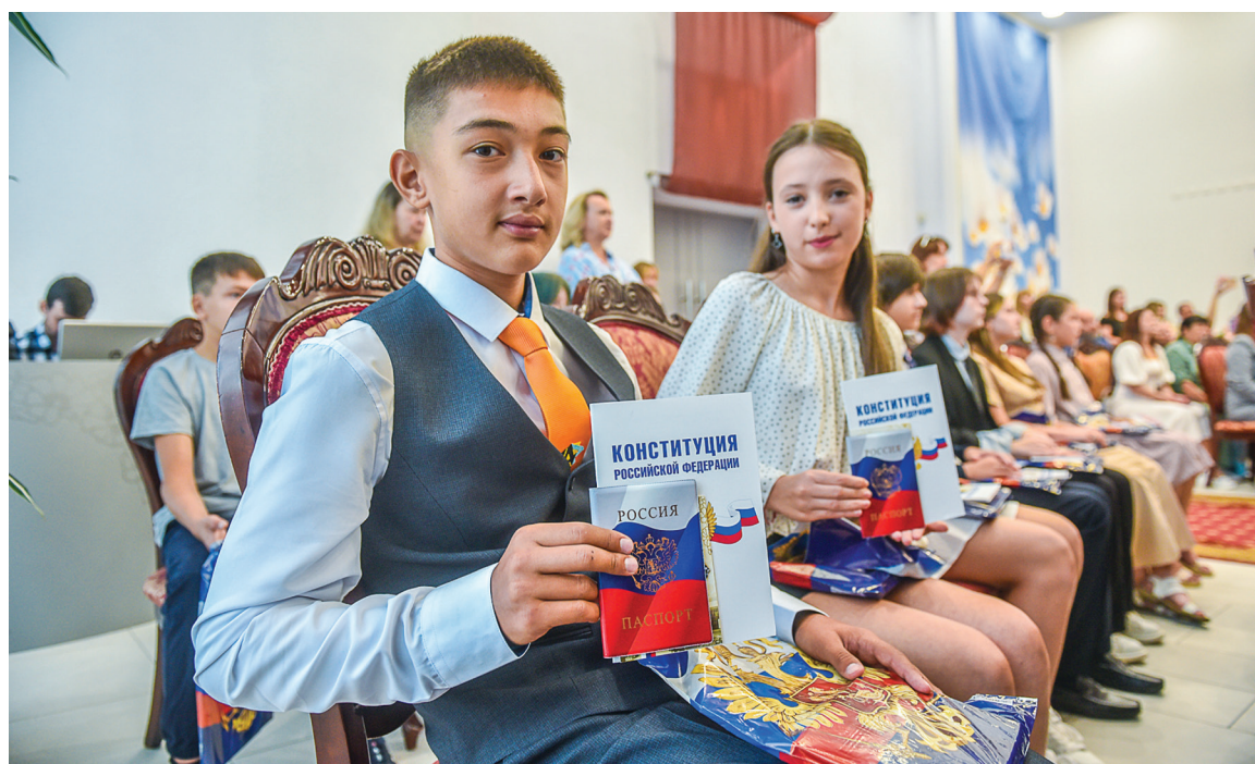
■ Только в Набережных Челнах проводится церемония торжественного вручения паспортов. Событие популярно и проводится дважды в месяц