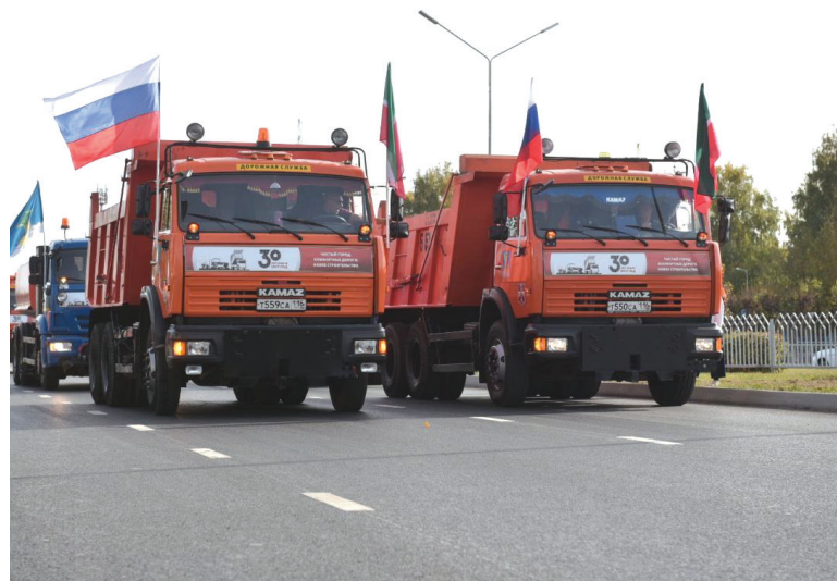
■ Работы выполнены в рамках нацпроекта «Безопасные качественные дороги»

«Визитной карточкой Набережных Челнов является не только легендарный «КАМАЗ», который выпускается в нашем прекрасном городе, но и хорошие дороги, которые появляются в городе благодаря таким проектам, как «Безопасные качественные дороги».