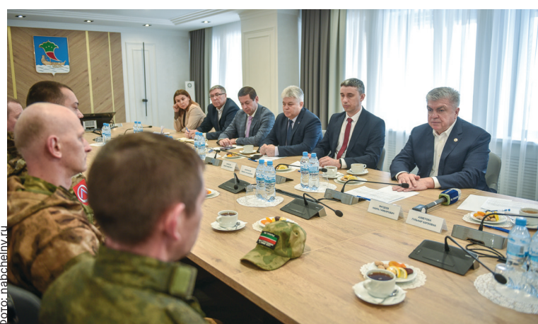
■ Встреча с бойцами, находящимися в краткосрочном отпуске, всегда проходит в теплой обстановке