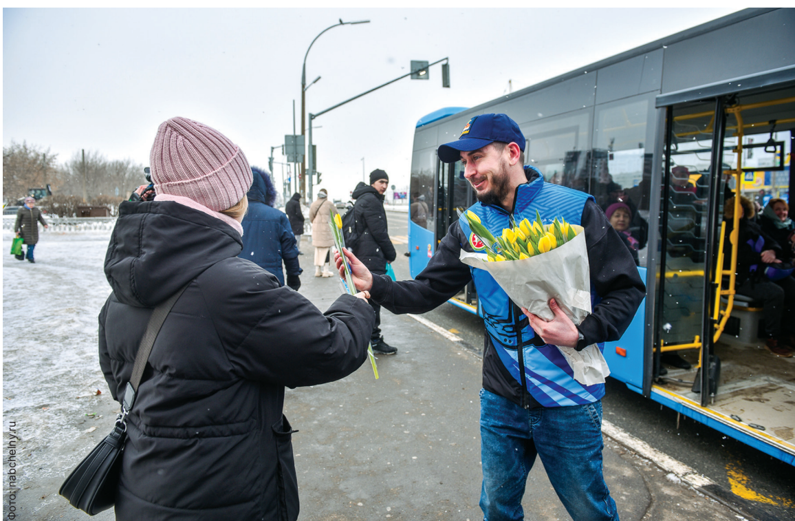
■ Сотрудники МУП «Горкоммунхоз» вручали 8 марта женщинам цветы