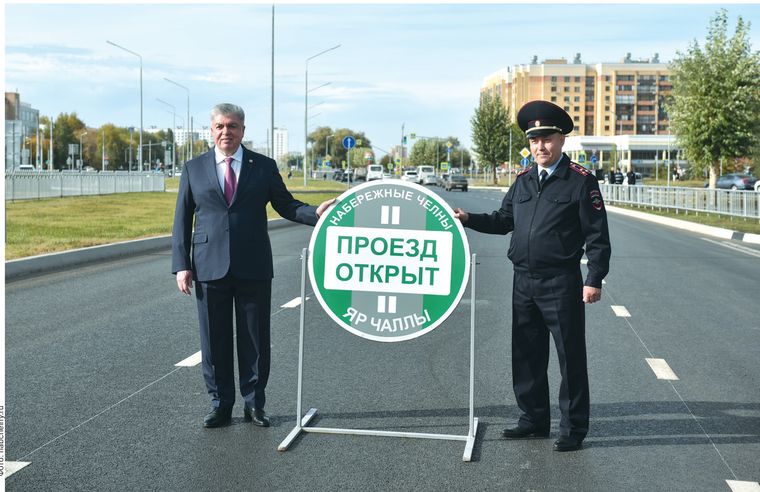
■ Проспект Яшьлек отремонтирован по нацпроекту «Безопасные качественные автодороги»

Обновляются и объекты спорта. «Спортивный комплекс «Олимпийский» – одна из основных школ по подготовке спортсменов, команд города и республики. Долгие годы челнинцы ждали капитального ре-