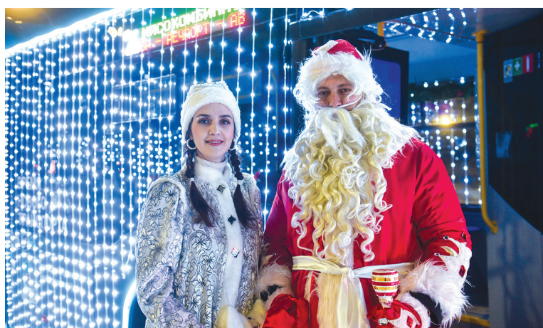
■ После открытия площади Азатлык всех встречали Дед Мороз и Снегурочка и, конечно, большие автобусы

МУП «Горкоммунхоз» запомнился горожанам и летом. Предприятие стало победителем традиционного фестиваля цветов, представив цветочную композицию «Сад прошлого» – в салон автобуса, полностью украшенного цветами, со звуками природы, заходили все посетители.