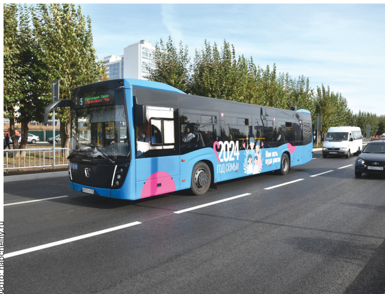
■ Протяженность отремонтированной дороги – 2,1 км